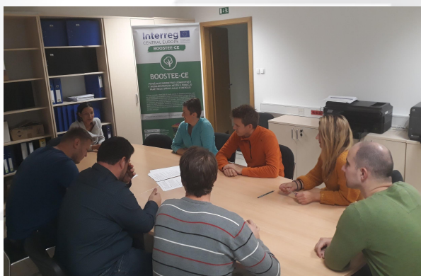
2. Focus Group Meeting projekta BOOSTEE-CE v Velenju.

Mestna občina Velenje in E-Zavod sta v Velenju organizirala t.i. 2. “Focus group meeting” projekta BOOSTEE-CE, ki je potekal 10. in 29. oktobra 2018. Dogodek je bil razdeljen na dva dela (srečanje z lokalnim podjetjem, podporno organizacijo in z regionalno agencijo za energijo). Udeleženci so bili obveščeni o napredku projekta BOOSTEE-CE in lokalnem pilotu - namestitvev pametnih števcov na objektu Glasbene šole Fran Korun Koželjski v Velenju. V središču razprave so bili prvi vmesni rezultati pilotne investicije ter prvi osnutek platforme OnePlace.