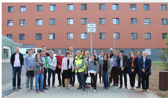
BOOSTEE-CE projektni tim na ogledu pilotne aktivnosti = nova bolnišnica v Uherské Hradiště, Češka - standard ničelne porabe energije.

Četrti partnerski sestanek projekta BOOSTEE-CE je potekal v Zlinu, Češka med 18. in 19. oktobrom 2018. Partnerji smo se sestali z namenom pregleda, razprave in ocene napredka projekta, testiranja OnePlace-3DEMS orodja ter načrtovanja prihodnjih dejavnosti. Na sestanku smo tudi razpravljali o aktivnostih v prihajajočem tretjem poročevalskem obdobju.