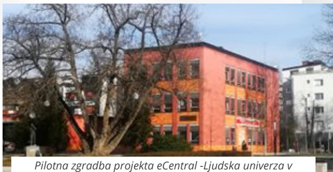
Pilotna zgradba projekta eCentral -Ljudska univerza v Velenju

Mestna občina Velenje bo v okviru projekta eCentral preizkusila pristop množičnega financiranja (crowdfunding) pri energetske obnove zgodovinske stavbe Ljudske univerze Velenje.