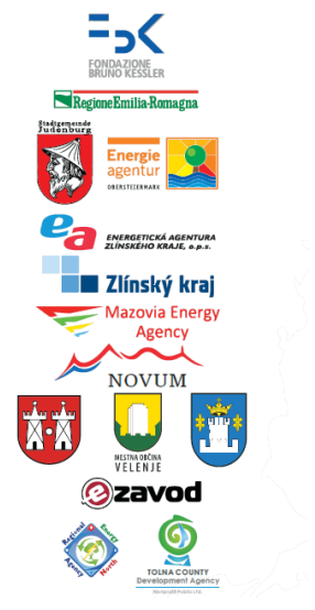
Zaključno virtualno srečanje partnerjev projekta BOOSTEE-CE