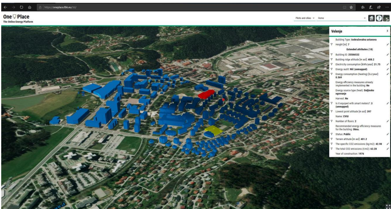
Pilotne aktivnosti v Velenju