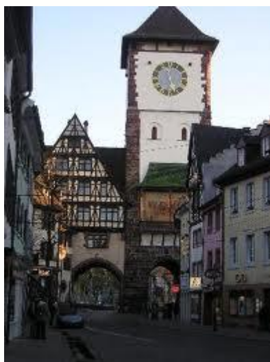
Freiburg – staro mesto

ZAČETEK PODJETNIŠTVA KULTURNE DEDIŠČINE NA (GLOBALNI) LOKALNI RAVNI: STRATEGIJE IN ORODJA ZA POVEZOVANJE, ZAŠČITO KRAJA, MOBILIZACIJO KULTURNIH VREDNOT, ŠIRITEV IZKUŠENJ