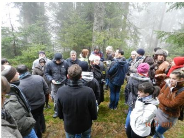
Tematska pot 4. Kaltenbronn

Pot »Divji petelin« je bila vzpostavljena oktobra 2012 v kraju Kaltenbronn na severu Schwarzwalda. To je pilotni projekt virtualne tematske poti, ki zahteva Android pametni telefon. Združuje GPS navigacijo z interpretacijo dediščine. Pot predstavlja sistem za upravljanje vsebin, ki omogoča lokalnim skupnostim, da ustvarijo lastne pametne aplikacije. Obiskovalci dobijo gesla, ki omogoča dostop do on-line zemljevida občine, ki zajema vse uradne pohodniške poti nekega okrožja. Določi se virtualna tematska pot »točka zanimanja«, ki se nahaja na tej progi. Za vsako »točko zanimanja« je mogoče naložiti besedilo in fotografije ter avdio in video posnetke, ki so pripravljene za tri različne ciljne skupine oziroma vsebine. Pot »Divji petelin« ponuja eno plast vsebine za otroke (z videi), za ne-strokovnjake odrasle in strokovno raven.