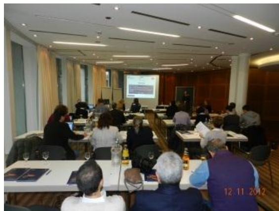
Sestanek tehničnega odbora

Srečanje se je nadaljevalo s sestankom upravnega odbora projekta. Razprava je bila povezana s poročilom ob koncu 4 poročevalskega obdobja (1. maj 2012, 30. november 2012). Vodilni partner je priporočil 1 marec 2013 za termin predložitve vmesnega poročila. Ponovno so opozorili, da lahko zaradi zamud pri izvajanju tekočih dejavnosti projekta pride do zmanjšanja proračuna.