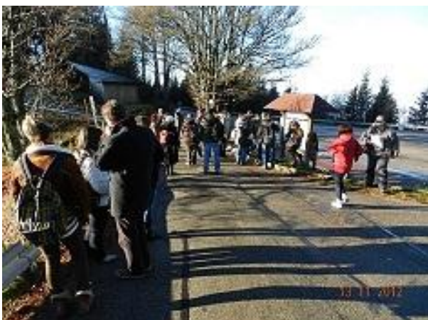
Tematska pot 1: Schauinsland - 1284 m

Oblikovanje poti Belchen je bila del večjega projekta "Interpretacija dediščine za trajnostni razvoj turizma«. Izdana je bila serija knjižic, ki v kombinaciji z oštevilčenimi mesti vzdolž poti spodbujajo obiskovalce k iskanju, jih opozarjajo na posebne značilnosti in zagotavljajo razlago ozadja. Mreža 9 samo-vodenih poti je bila razvita v okrožjih 8 vasi in podeželskega mesteca Schönau. Območje se nahaja v južnem Schwarzwaldu na vzhodnem pobočju Belchen (1414 m) in v dolini reke Große Wiese. Vsaka pot ima osrednjo temo - od geologije paleozoika, sledi zadnje poledenitve v ledeni dobi, od zgodovine mesta do današnjih dni.