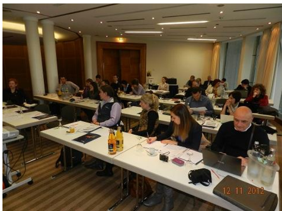
Sestanek projektnega odbora

Sledil je finančni pregled projekta. Po oddanem 3 vmesnem poročilu je vodilni partner ponovno opozoril na premajhno črpanje sredstev, pri skupni porabi razpoložljivih sredstev zaostajamo najmanj za 50 %. Zato je pozval vse projektne partnerje, da pospešijo projektne aktivnosti in s tem povečajo porabo finančnih sredstev. Finančni vodja projekta je opozoril na popravke pri 3. vmesnem poročilo. Priporočil je večjo pozornost pri izpolnjevanju partnerskih poročil, kjer se pojavljajo majhne napake, kar nato povzroča odložitev povračil finančnih sredstev.