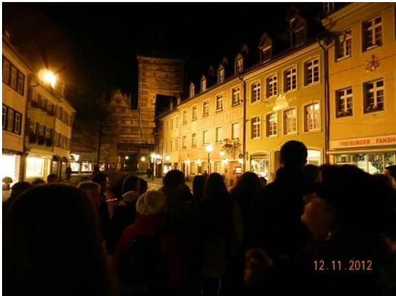
Nočni ogled Freiburga