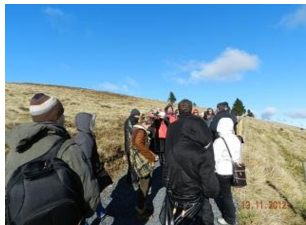
Tematska pot 2: Belchen - 1414 m