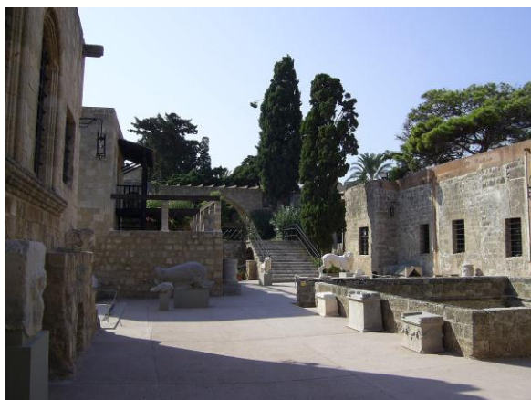
Arheološki muzej v Rodosu

ZAČETEK PODJETNIŠTVA KULTURNE DEDIŠČINE NA (GLOBALNI) LOKALNI RAVNI: STRATEGIJE IN ORODJA ZA POVEZOVANJE, ZAŠČITO KRAJA, MOBILIZACIJO KULTURNIH VREDNOT, ŠIRITEV IZKUŠENJ