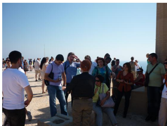
Obisk akropole v Lindorju

Sledil je ogled starega mesta Rodos z vhodnimi vrati in obrambnim jarkom, veliko palačo in ulico Knight. Rodos je glavno mesto otoka Rodos. Znan je bil znan že v antiki kot mesto Kolos z Rodosa, eno od sedmih čudes sveta. Trdnjava Rhodes, ki jo je zgradil Hospitalliers, je eno od najbolj ohranjenih srednjeveških mest v Evropi, ki je bilo leta 1988 imenovan za UNESCO seznam svetovne dediščine. Otok in mesto Rhodes je priljubljena mednarodna turistična destinacija.