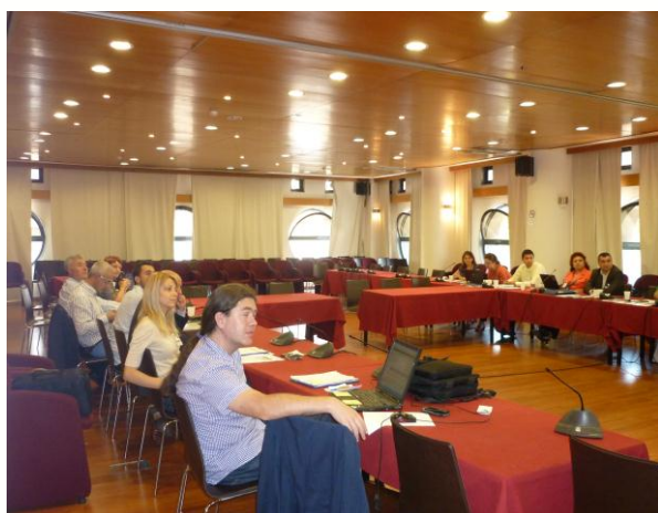
Prvo partnersko srečanje

Prvi dan srečanja je bil namenjen načrtovanju aktivnosti projekta, terminskemu načrtu dogodkov in pregledu finančne strukture projekta. Predstavljen je bil komunikacijski načrt. Ob koncu sestanka je potekala odprta razprava.