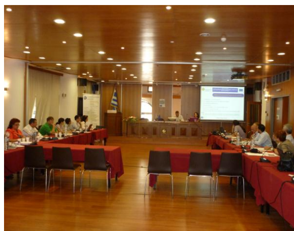
Predstavitve projektnih partnerjev