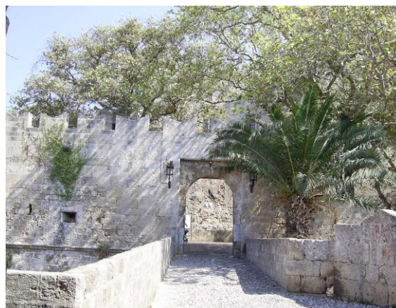
Vrata starega mesta Rodos