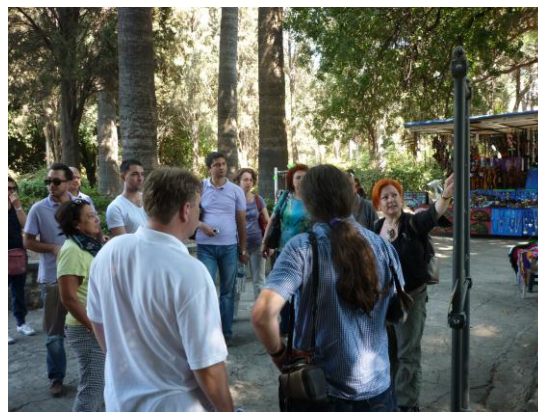
Obisk starega mesta Rodos